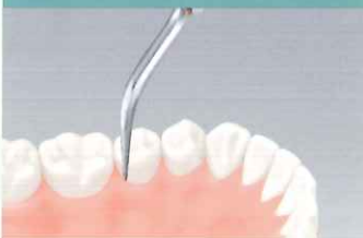
スケーリングチップ