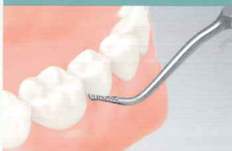
う蝕除去用チップ