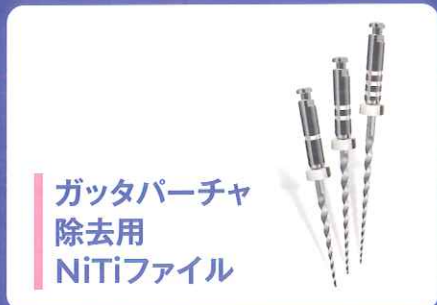
ガッタパーチャ 除去用 NiTiファイル

セール期間 2025年 2月3日(月)～3月31日(月) 14:30pmまでのご注文