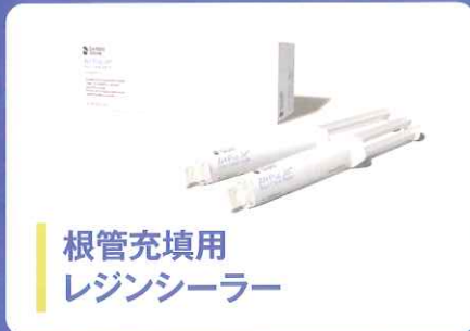
根管充填用 レジンシーラー