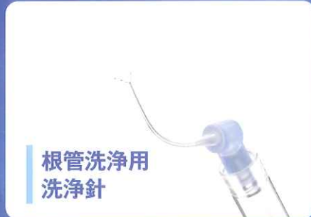
根管洗浄用 洗浄針