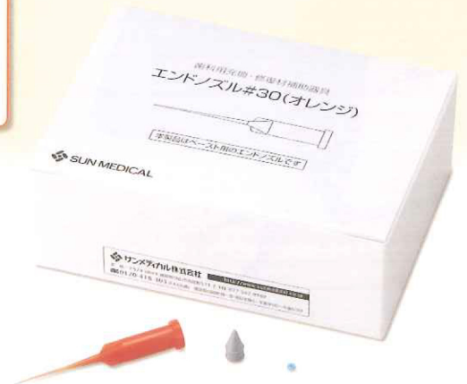
エンドノズル™#30(オレンジ)