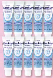
※Check-Up standard マイルドピュアミント 試供品のイメージ画像です