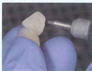
② サンドブラスト処理