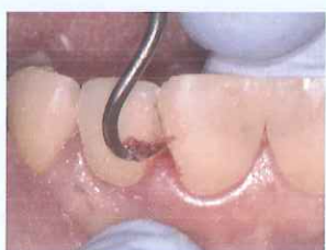
⑦ 余剰セメント除去