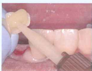
⑤ 補綴物側にエステセムⅡ ペースト塗布