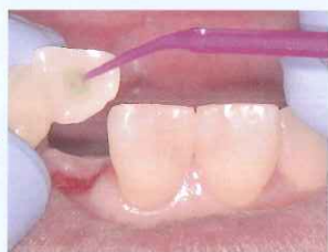
③ 補綴物に ボンドマー ライトレスⅡ塗布、 エアブロー