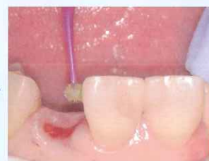
④ 口腔内被着面に ボンドマー ライトレスⅡ塗布