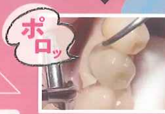
セラミックスクラウンのセット

管理医療機器 歯科接着用レジンセメント ジーシー ジーセム ONE EM 301AKBZX00021000