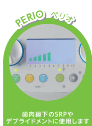
歯肉線下のSRPや デブリドメントに使用します

ペリオ(弱)、エンド(中)、スケーリング(強)モードの3種類あります。また、目的に合わせて細部まで水量調整が可能です。