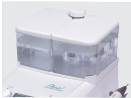
残量が分かり易い!