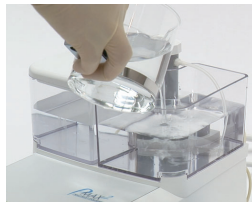
液体の補充が簡単!