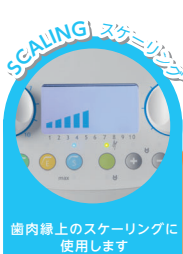
歯肉線上的スケーリングに 使用します