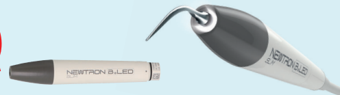
ニュートロンLEDスリムハンドピース (LED付)