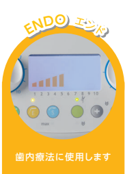
歯内療法に使用します