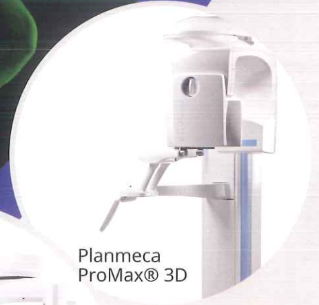
Planmeca ProMax® 3D