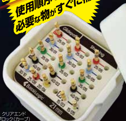
クリアエンドブロック(カーブ)