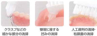
クラスプなどの細かな部分の清掃 / 顎堤に接する凹みの清掃 / 人工歯列の清掃・粘膜炎の清掃