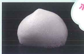
汚れに密着するきめ細かい泡