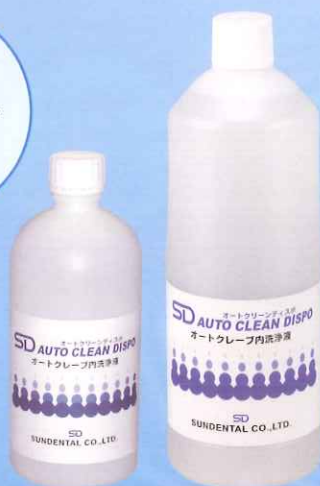
500mL 1,200mL 〈SDオートクリーン ディスポ〉