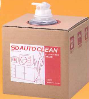
オートクリーン 5L オートクレーブ専用液