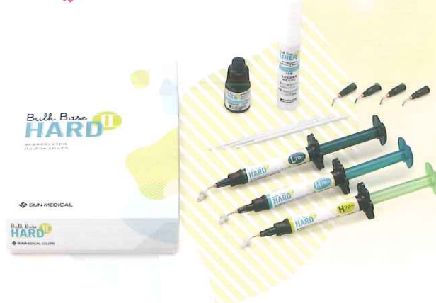
バルクベース®ハードII