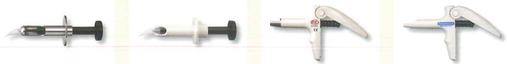
マークI マークII スナップフィット マークIII E-Z マークIII スナップフィットレギュラー

下記に示したCentrix社製のC-Rシリンジ(製造販売元:(株)モリタ)が使用可能です。