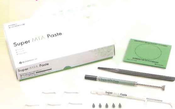
スーパーMTAペースト™