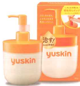
ユースキン 180g ポンプ