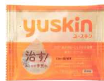
ユースキン 4g サンプル ストラップ付き