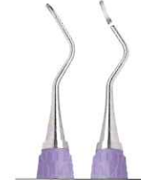
コロンビア大学型 4R/4L