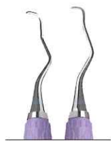
ランガー 3/4 上顎臼歯用