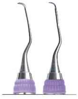
ランガー ミニファイブ 1/2 ★ 下顎臼歯用