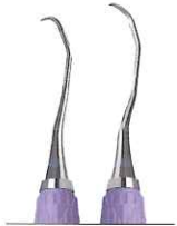
ランガー 1/2 ★ 下顎臼歯用