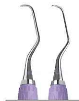
ランガー 5/6 前歯用