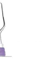
ランガー ミニファイブ 5/6 前歯用