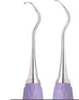
コロンビア大学型 13/14