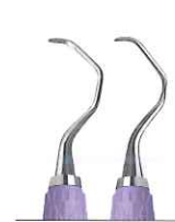
ランガー 17/18 上下顎臼歯用