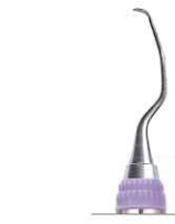
ランガー ミニファイブ 3/4 上顎臼歯用