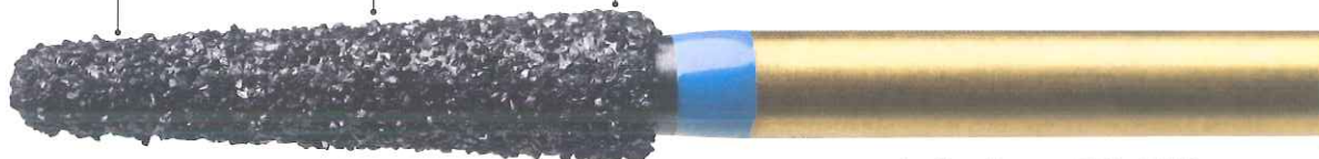
プレデタージルコニア Z856-018M