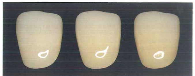
レジンブロック ▶ Bプラスを1層塗布 ▶ Bプラスを2層塗布