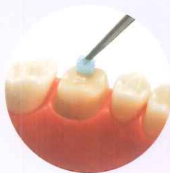
シーリング・コーティング

シーリング・コーティング以外にも知覚過敏抑制材、ボンディング材としてもご使用いただける、マルチユースな材料です。