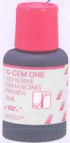
歯科用象牙質接着材 管理医療機器 228AKBZX00104000