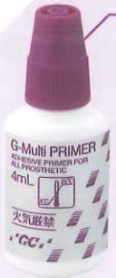
歯科セラミックス用接着材料 管理医療機器 228AABZX00003000