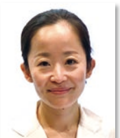
松成彩絵 パール歯科医院 半蔵門 (東京都)