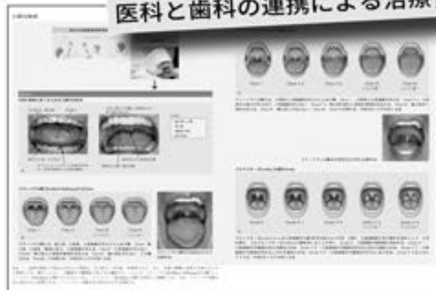
口腔内検査におけるスクリーニング事項 (第6章より)