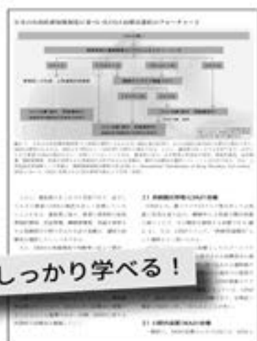
OSA治療法選択のフローチャート (第2章より)