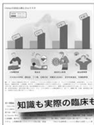
OSAの合併症の例とそのリスク (第1章より)