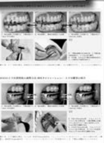
歯科タイトレーション (第11章より)