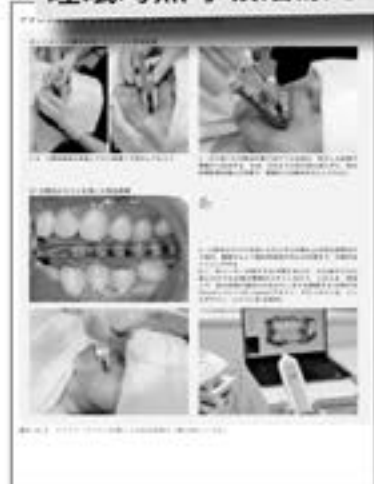
アナログ印象/デジタル印象による咬合採得 (第9章より)