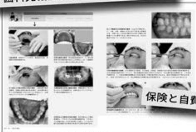
口腔内検査の実際 (第7章より)