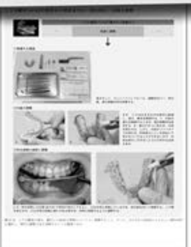
口腔内装置製作と装着 (第10章より)