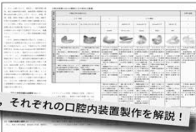
口腔内装置(OA)の種類 (第8章より)