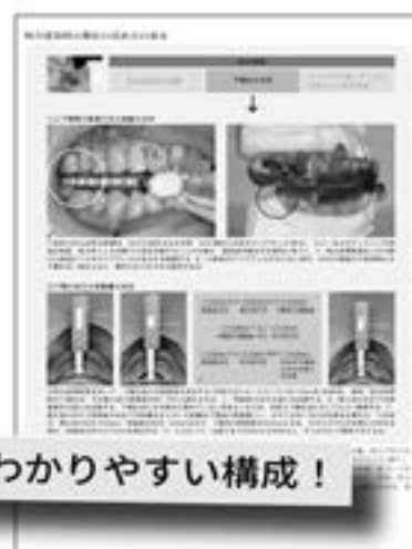
咬合採得時の顎位の決め方 (第9章より)