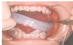
Quick IDBSの製作方法と使い方を写真付きで詳しく解説