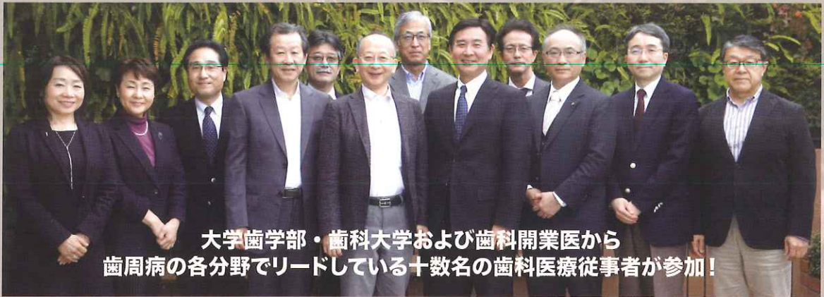
大学歯学部・歯科大学および歯科開業医から 歯周病の各分野でリードしている十数名の歯科医療従事者が参加!

Chapter 5 Er:YAG レーザーによる根面のデブライドメント (青木章)