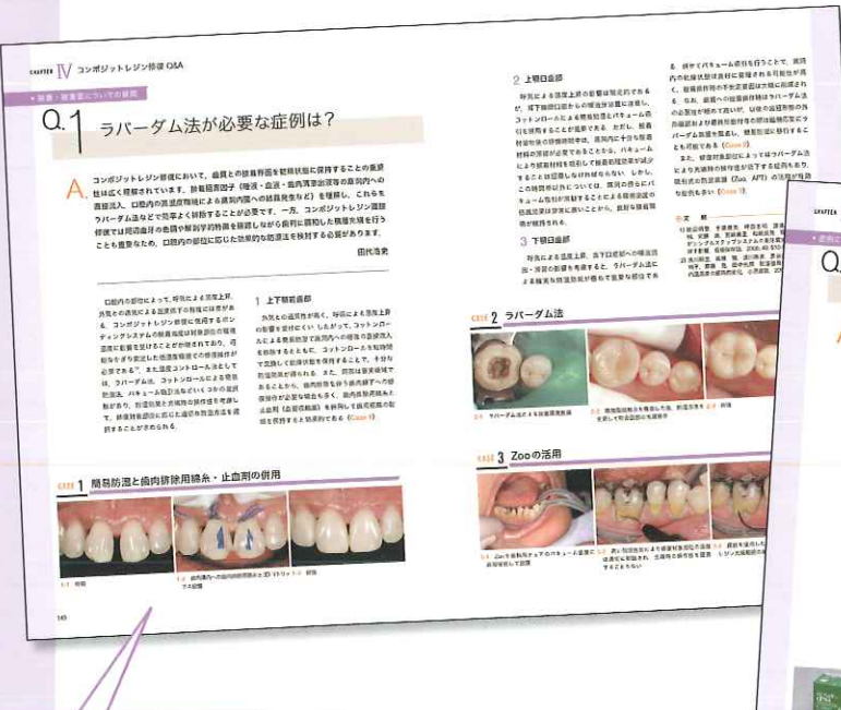
ラバーダム法、明度のコントロール、術後疼痛の予防法と いった、読者がさらに詳しく知りたい内容を網羅

コンポジットレジン修復においてよく聞かれる疑問を取り上げ、 簡潔にわかりやすく答えます.