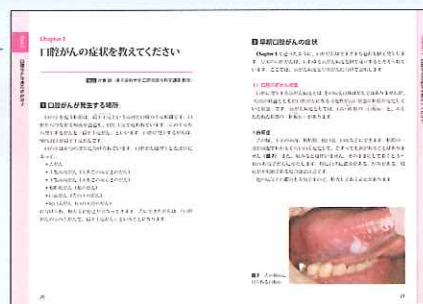
▲典型的な症例を用いて症状を解説。