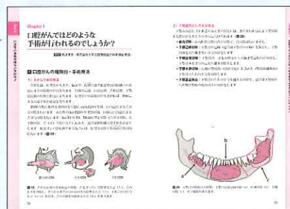
●行われる手術のイメージはイラストで解説。