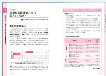
●治療費の公的補助についても解説。