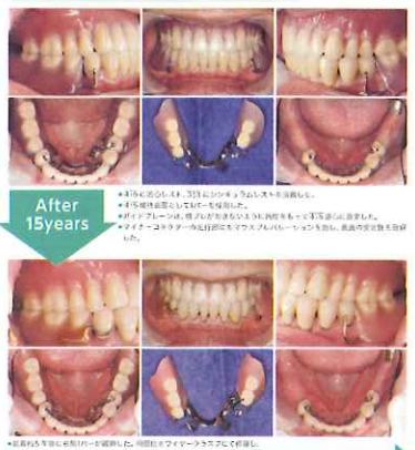
15年以上天然歯を守り続けたこのパーシャルデンチャーの製作ステップは?