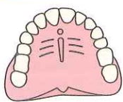
まず形を覚えよう