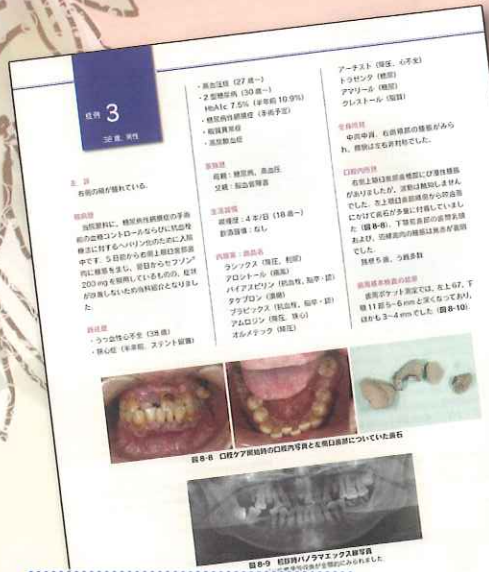
8 糖尿病の患者さんが来院したら