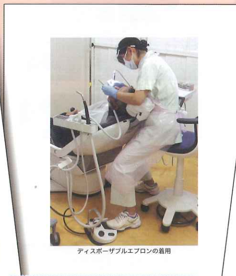
ディスプレイエプロンの着用