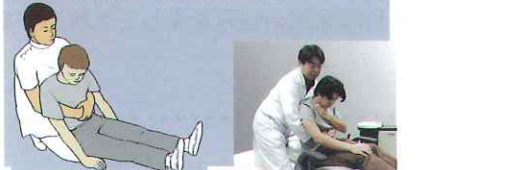
気管内の異物に対しては、胸腔内圧を瞬間的に高めて排出させるハイムリック法が行われる。歯科ユニット上では、患者の背後から抱えるようにする。