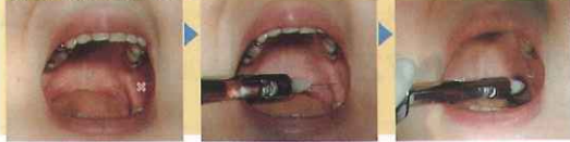
刺入点は下顎孔伝達麻酔と同様であるが、必ずしも咬合平面の1 cm 上方である必要はない。下顎孔の前方に注射針を進めるため、対側の第一大臼歯方向から刺入する。ここでは30 G、21 mm 注射針を用いている。10 mm の刺入で翼突下顎窩内に到達する。