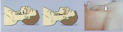
気道の閉塞は、血液、ガーゼ、歯、捕食物、印象材などの異物や、舌根の沈下によって生じる。気道閉塞が生じると、吸気時に胸が下がり、腹膨が上がるシーソー呼吸、鎖骨上窩が陥凹する tracheal tug がみられる。