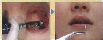
吸引テストを行い、1 カートリッジの局所麻酔薬を注射する。2~3 分以内に舌の麻痺が、5~10 分で下唇、オトガイ皮膚の知覚麻痺が生じ、治療が可能となる。

ここで紹介する下歯槽神経近位伝達麻酔法（近位伝達麻酔法）は、筆者らが報告した方法で、下顎孔（下歯槽神経）を刺入目標とせず、神経・血管損傷の危険の少ない下顎孔より前方の翼突下顎窩の中に注射針を進め、ここで局所麻酔薬を注射することによって下歯槽神経の麻酔を得ようとするものである。