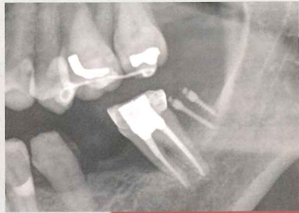
大白歯のアップライトが完了