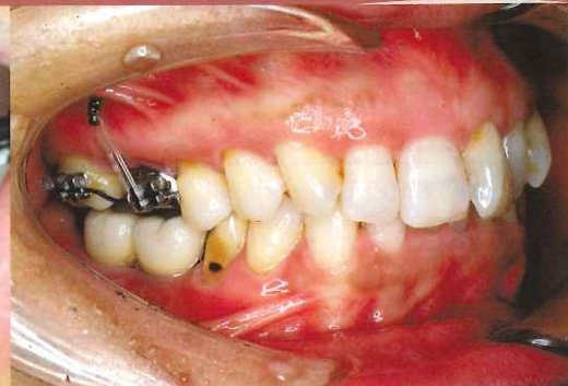
大白歯の圧下が完了し、下顎へ補綴治療