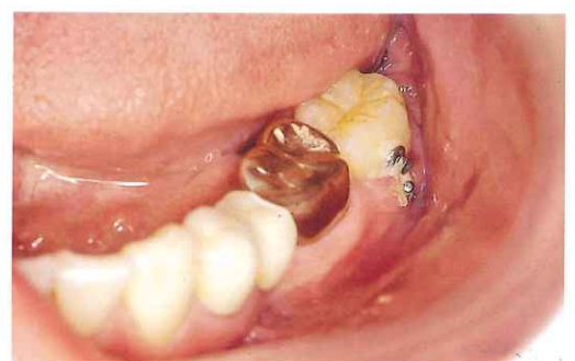
舌側傾斜している第二大臼歯