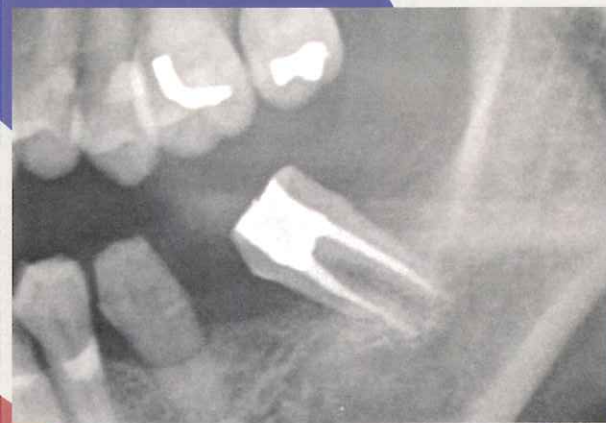
近心舌側傾斜している第二大臼歯