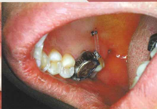
頬側・舌側のアンカースクリューから牽引