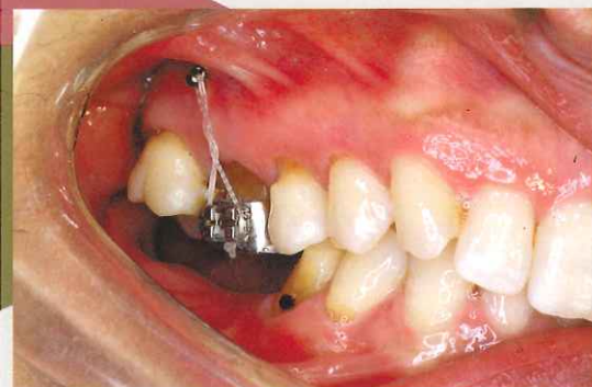
挺出している第一大臼歯