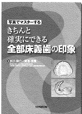
A4判・96頁・オールカラー・定価6,825円(税込)