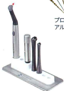
SmartLite Pro EndoActivator