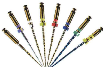
プロテーパー アルティメット