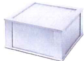
B031:フリーアームS用 スーパーバイオフィルタ × ( )