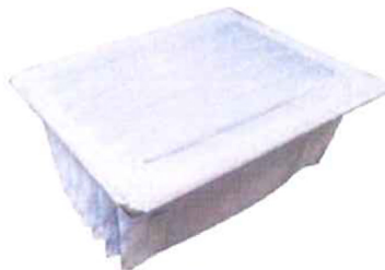
B030:フリーアームS用 バッグフィルタ × ( )