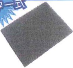
B029:フリーアームS用 塵受けフィルタ × ( )