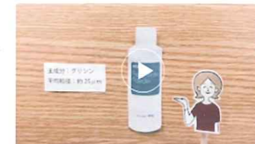
メルサーージュ エピック 2in1