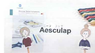
エースクラップ社製スケーラー

DH通信の中でご紹介している診療製品の使い方のコツや松風歯科衛生士による製品の説明動画がいつでも見放題。