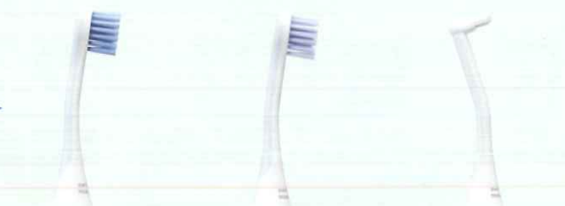
パワーブラシヘッド センシティブブラシヘッド シングルブラシヘッド