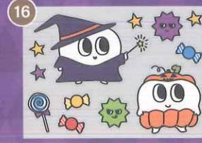
16 【PP】デンタルちゃんの ハロウィンミニA