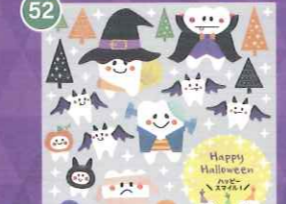
52 【VP】ハッピースマイル ハロウィン