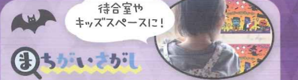
32 【PP】コミックモンスターの まちがいさがし