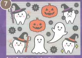
7 【PP】歯をみがごう! ハロウィンミニB