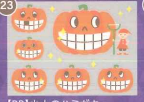
23 【PP】小人のハミガキ ハロウィンミニC