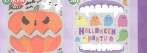
37 NEW 【VP】フォトスポット ジャンボかぼちゃ Trick or Treat