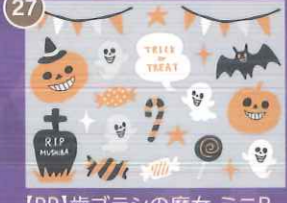
27 【PP】歯ブラシの魔女 ミニB