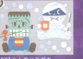
25 【PP】小人のハミガキ ちびモンスターミニB