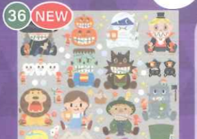
36 NEW 【VP】小人のハロウィン アソート