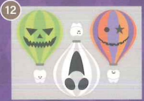
12 【PP】歯の旅立ちハロウィン バルーンミニB