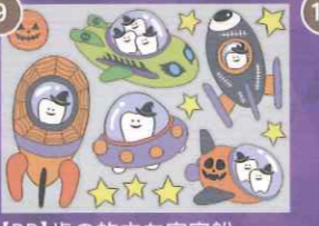
9 【PP】歯の旅立ち宇宙船 ハロウィンミニA