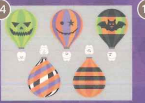
14 【PP】歯の旅立ちハロウィン バルーンミニD