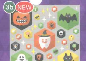
35 NEW 【VP】歯のハロウィン六角形