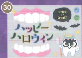
30 【PP】toothくんと仮装メガネA