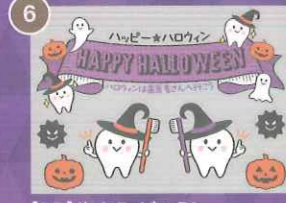
6 【PP】歯をみがごう! ハロウィンミニA