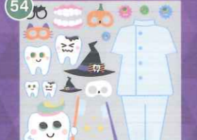
54 【VP】顔出しデコラ ハロウィンは歯医者さんに