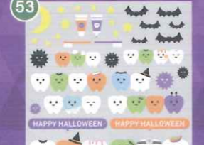
53 【VP】にっこりトゥース フレンズハロウィン