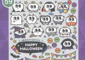
59 【VP】デンタルちゃんの ハロウィン