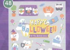
48 【VP】デンタルクリニック ハロウィンの待合室