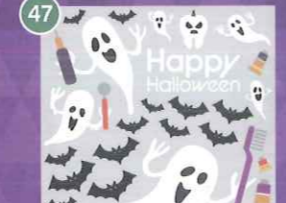
47 【VP】歯みがき粉おぼけ