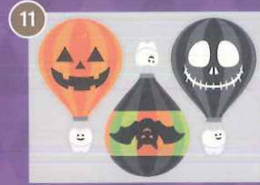
11 【PP】歯の旅立ちハロウィン バルーンミニA