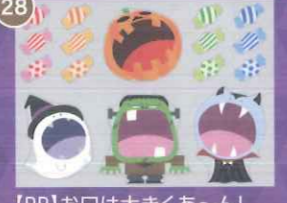
28 【PP】お口は大きくあ〜ん! ハロウィンミニ A