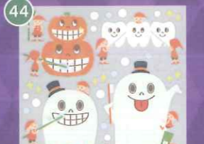
44 【VP】小人のハミガキ おぼけ