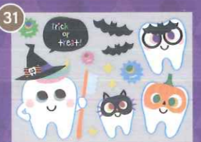
31 【PP】toothくんと仮装メガネB