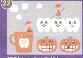
22 【PP】小人のハミガキ ハロウィンミニB