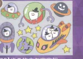
10 【PP】歯の旅立ち宇宙船 ハロウィンミニB