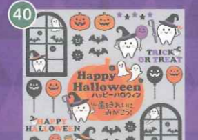
40 【VP】歯をみがごう! ハロウィンbig