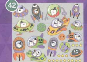
42 【VP】歯の旅立ち宇宙船 ハロウィン