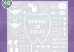
49 【VP】DENTAL OR TREAT