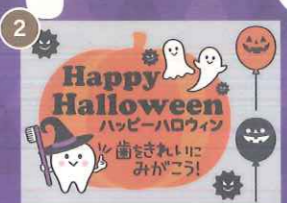
2 【PP】歯をみがごう! ハロウィンbigミニA