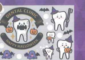
5 【PP】は(歯)っちゃんの ハロウィン ミニ