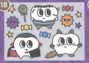
18 【PP】デンタルちゃんの ハロウィンミニC