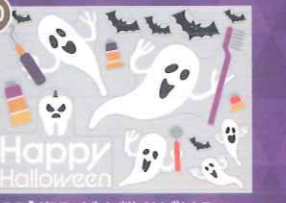
20 【PP】歯みがき粉おぼけミニ