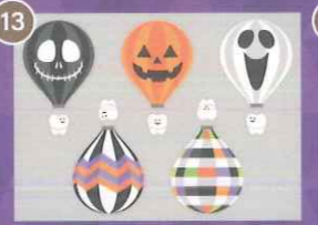
13 【PP】歯の旅立ちハロウィン バルーンミニC