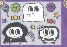
19 【PP】デンタルちゃんの ハロウィンミニD