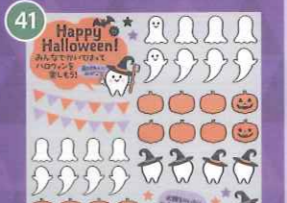
41 【VP】ワイワイ歯をみがごう! シリーズハロウィン