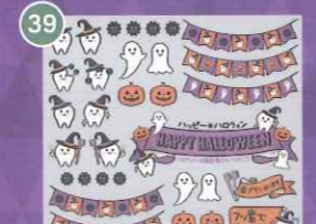
39 【VP】歯をみがごう! ハロウィン