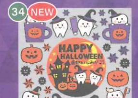
34 NEW 【VP】歯をみがごう! ハロウィンinコップ