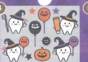
4 【PP】歯をみがごう! ハロウィンbigミニC