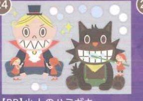
24 【PP】小人のハミガキ ちびモンスターミニA