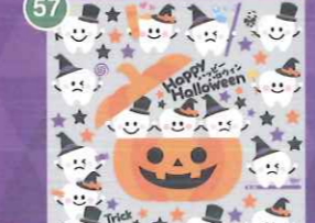
57 【VP】歯〜の3兄姉弟 ハロウィンバージョン