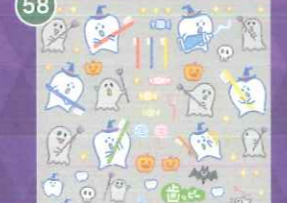
58 【VP】歯ッピー歯ロウィン