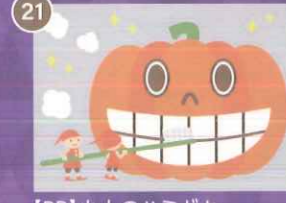
21 【PP】小人のハミガキ ハロウィンミニA