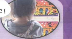
33 【PP】モンスターエッグの まちがいさがし