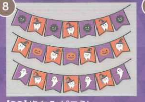
8 【PP】歯をみがごう! ハロウィンミニC