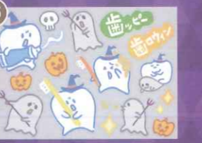
15 【PP】歯ッピー歯ロウィンミニ