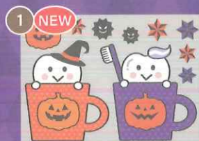
1 NEW 【PP】歯をみがごう! ハロウィンin コップミニ