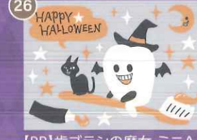
26 【PP】歯ブラシの魔女 ミニA