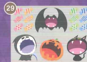
29 【PP】お口は大きくあ〜ん! ハロウィンミニ B