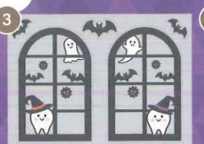
3 【PP】歯をみがごう! ハロウィンbigミニB