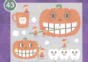
43 【VP】小人のハミガキ ハロウィン