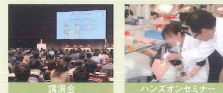
講演会 ハンズオンセミナー