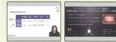
LIVE配信・オンデマンド

セミナー・イベントの日程や内容は お届けするイベントインフォメーションで お知らせします！