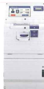
セルフレジ 380シリーズ