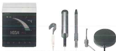
歯科用根長測定器 (一般的電気手術器) ルート ZX3