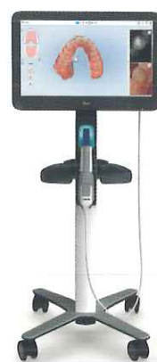
デジタル印象採得装置歯科技工室設置型 コンピュータ支援設計・製造ユニット 歯科診断用口腔内カメラ iTero エlement 5D Plus