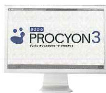
デンタルオフィスコンピュータ DOC-5 プロキオン 3