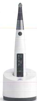
歯科多目的治療用モータ トライオートZX2+