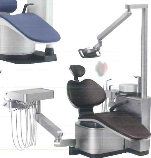
歯科用ユニット シグノ T500