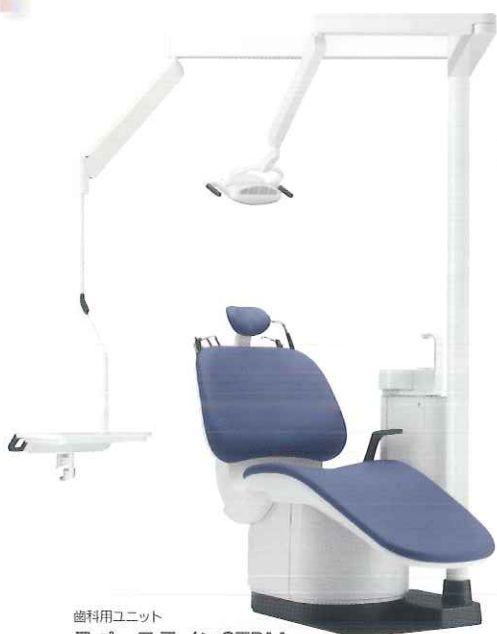
歯科用ユニット スペースラインSTBM フリーアクションレタータイプ