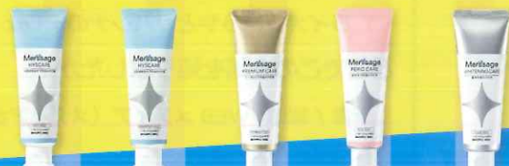
メルサーージュヒスケア 香味: 2種類